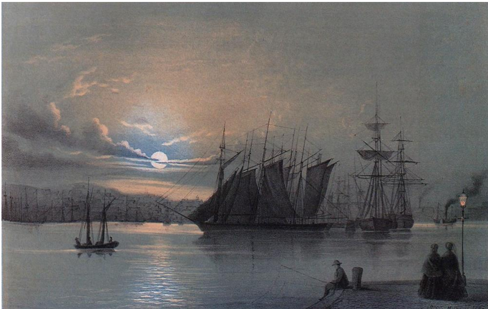
[Hamnen i månsken]

del av texterna, har "återskapats" och getts ut som bok, med färglagda versioner av originalbilderna: